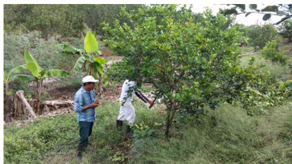
Figura 5. Toma de muestras de psílicos en huertas comerciales