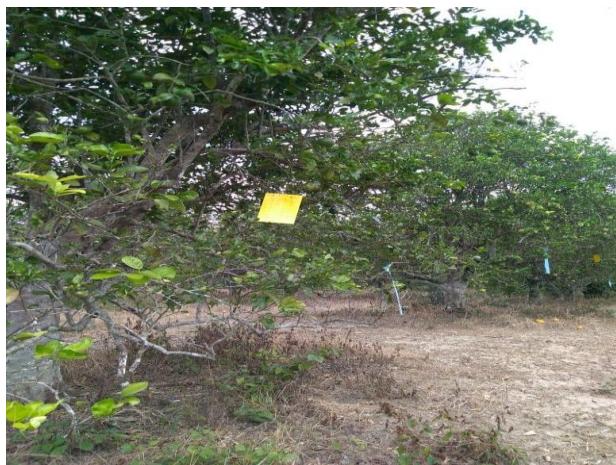
Figura 2. Trampas establecidas para el monitoreo del PAC.

El promedio de diaforinas obtenido en el mes de noviembre fue de 0.514 diaforinas/trampa/mes.