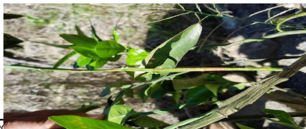
Figura 3. Exploración para detección de síntomas de Leprosis