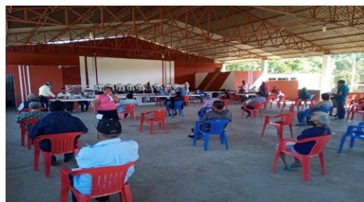
Figura 7. Talleres participativos a productores sobre síntomas de plagas reglamentadas de los cítricos y control de diaforina

d) Entrenamiento: Con el propósito de difundir la estrategia operativa de la Campaña, así como la sensibilización hacia los productores sobre la importancia de las enfermedades y adopción de las acciones mediante el establecimiento de AMEFIs, se realizaron 4 Talleres Participativos en los Municipios de Fco. Z. Mena y V, Carranza, correspondientes a la Región Sierra Norte; Acateno y Tenampulco, correspondientes a la Región Sierra Nororiental. Con esta acción se benefició un total de 42 productores.