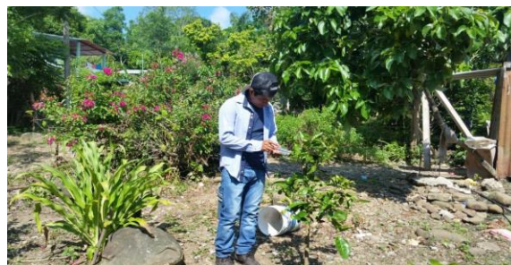
Figura 6. Toma de muestras de psílicos en rutas urbanas

d) Entrenamiento: Con el propósito de difundir la estrategia operativa de la Campaña, así como la sensibilización hacia los productores sobre la importancia de las enfermedades y adopción de las acciones mediante el establecimiento de AMEFIs, se realizaron 4 Talleres Participativos en los Municipios de Fco. Z. Mena y V, Carranza, correspondientes a la Región Sierra Norte; Acateno y Tenampulco, correspondientes a la Región Sierra Nororiental. Con esta acción se benefició un total de 42 productores.